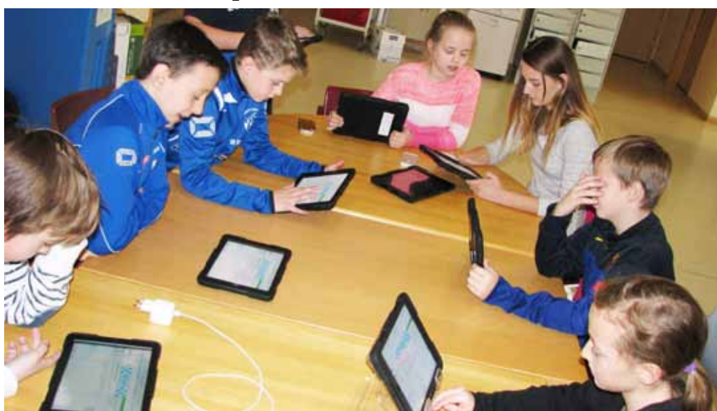
Eleverna på Älvsåkersskolan spelar match i Yes2chess via sina surfplattor. I den första omgången vann alla fyra lagen från skolan sina matcher.