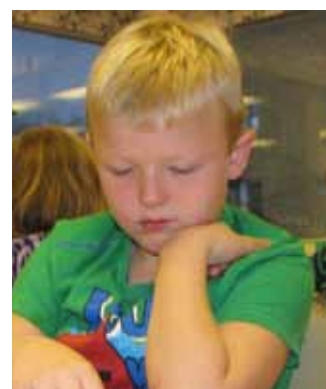
Calle Cernjul 7 år Ekenbergsskolans SK Stockholm