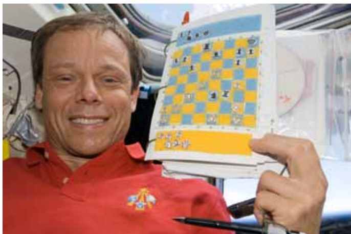
Christer Fuglesang i rymden med sitt hemmagjorda schackbräde.

År 2006 blev Christer Fuglesang den förste svenske rymdfararen. Bredvid att vara astronaut är han docent i partikelfysik, författare till ungdomsböcker, samt hängiven schackspelare. Framöver kommer Christer att tillsammans med Schack i skolan ta fram en "Christers kluring" till varje nyhetsbrev, kluringar som ni kan lösa själva eller delge barnen i er schackgrupp.