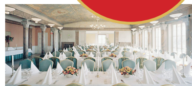
Spellokalen blir Hazeliussalen.