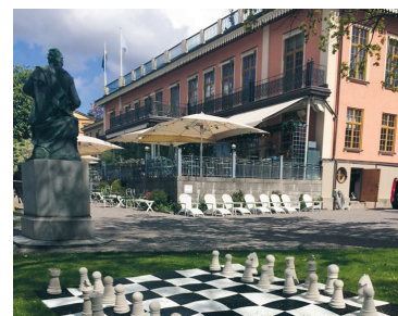
Parken utanför Scandic Hasselbacken.