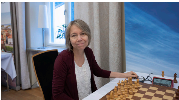
Pia Cramling i Lidköping Open 2022.