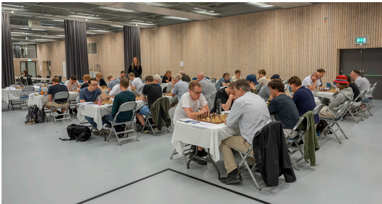
Äntligen kunde Schack-SM genomföras som vanligt igen. Tävlingarna spelades på Fyrishov i Uppsala 1-10 juli.